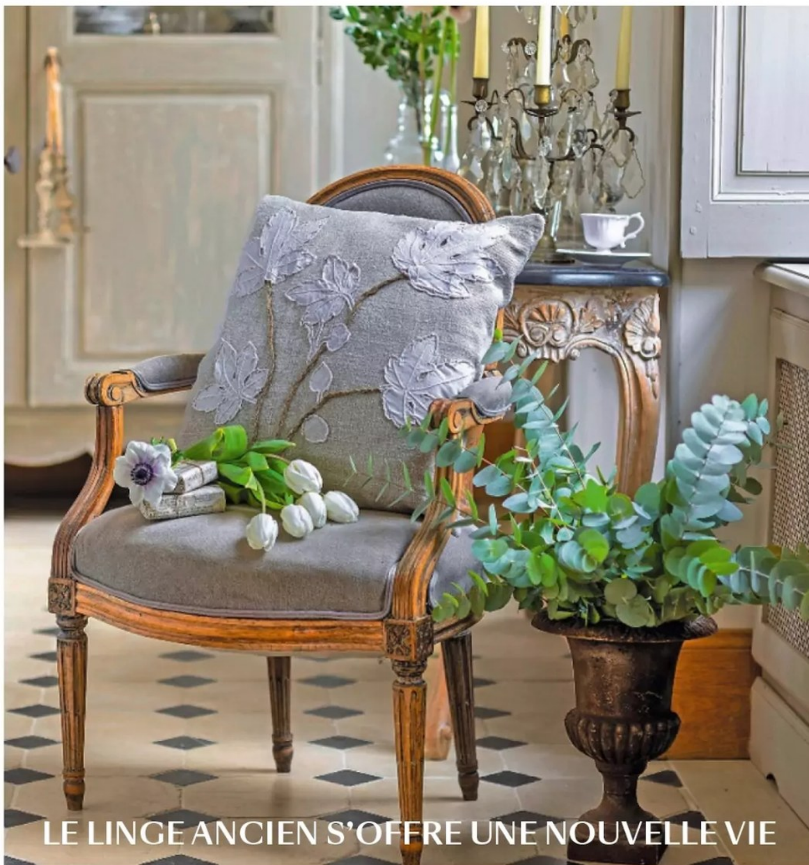
LE LINGE ANCIEN S'OFFRE UNE NOUVELLE VIE