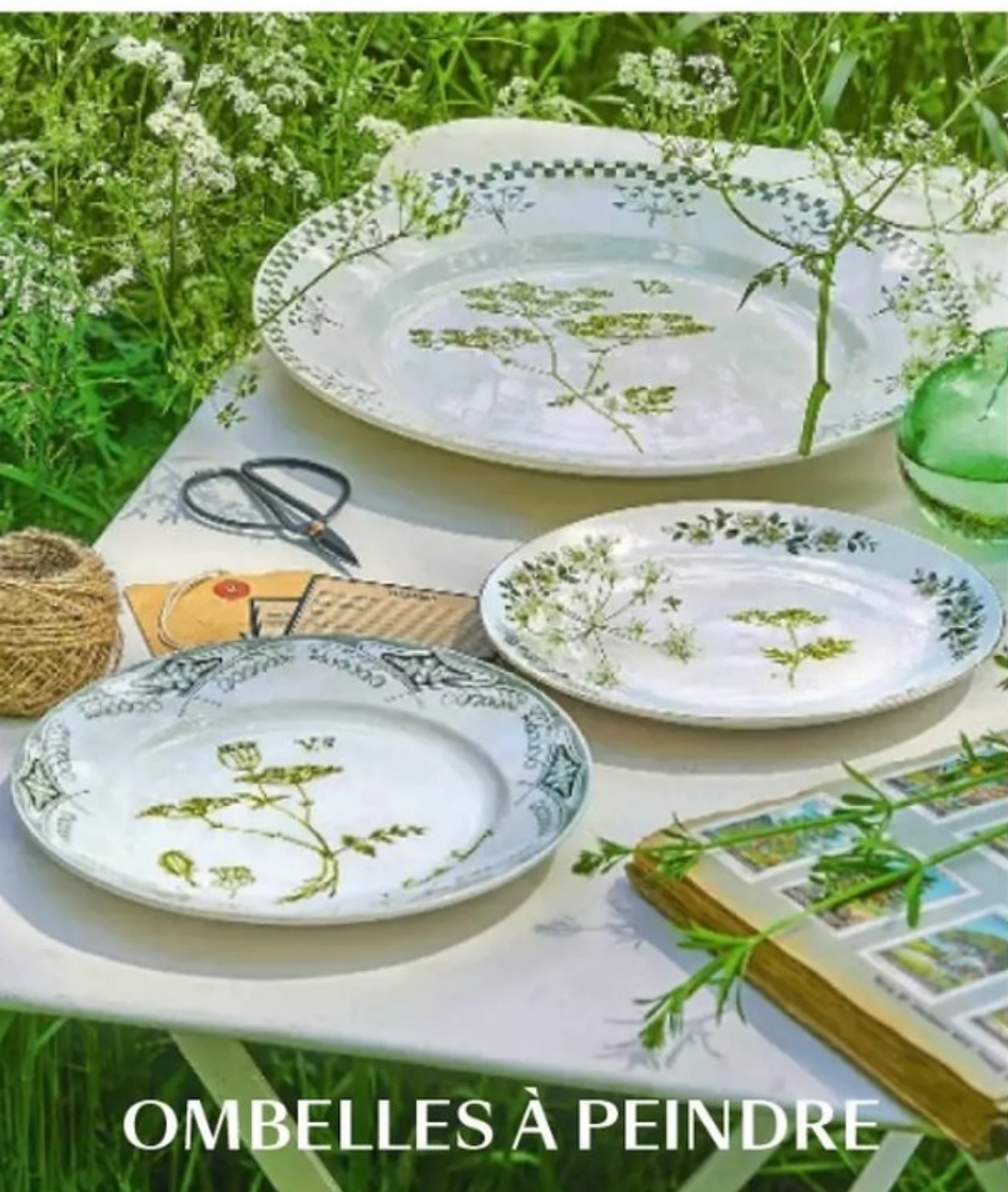
OMBELLES À PEINDRE

UN PRINTEMPS AU VERT C'EST LA BONNE SAISON POUR RÉCUPÉRER, RECYCLER, CUSTOMISER, CUISINER BON ET BIO... RÉINVENTER UNE MAISON ÉCORESPONSABLE!