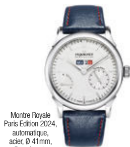
Montre Royale Paris Edition 2024, automatique, acier, Ø 41mm, Peigninet.

Quelques créations d'actualités parmi les collections inspirées par les Jeux Olympiques.