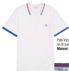
Polo tricolore en fil lumière, Maison Montagut.