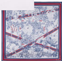
Toile de Jouy revisitée d'après les disciplines phares des JO, Maison Malfroy.