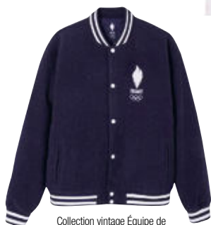
Collection vintage Équipe de France, Decathlon (fournisseur officiel des bénévoles).