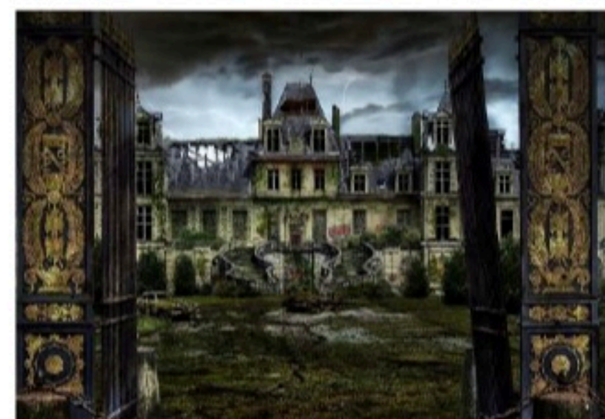
Yoann Agnès/Paradox beyond appearances

Il crée des images du château après l'apocalypse