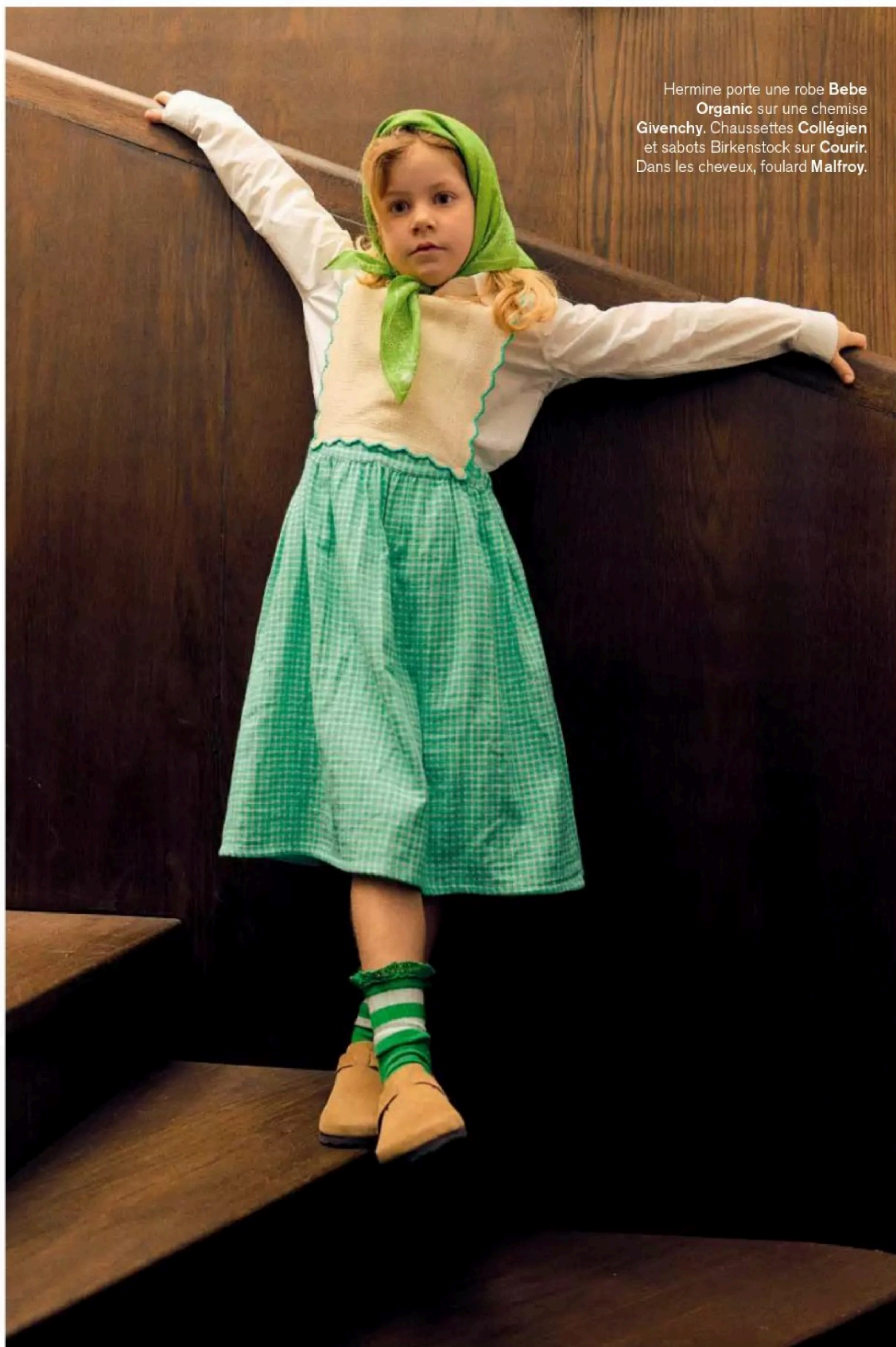
Hermine porte une robe Bebe Organic sur une chemise Givenchy . Chaussettes Collégien et sabots Birkenstock sur Courir . Dans les cheveux, foulard Malfoy .